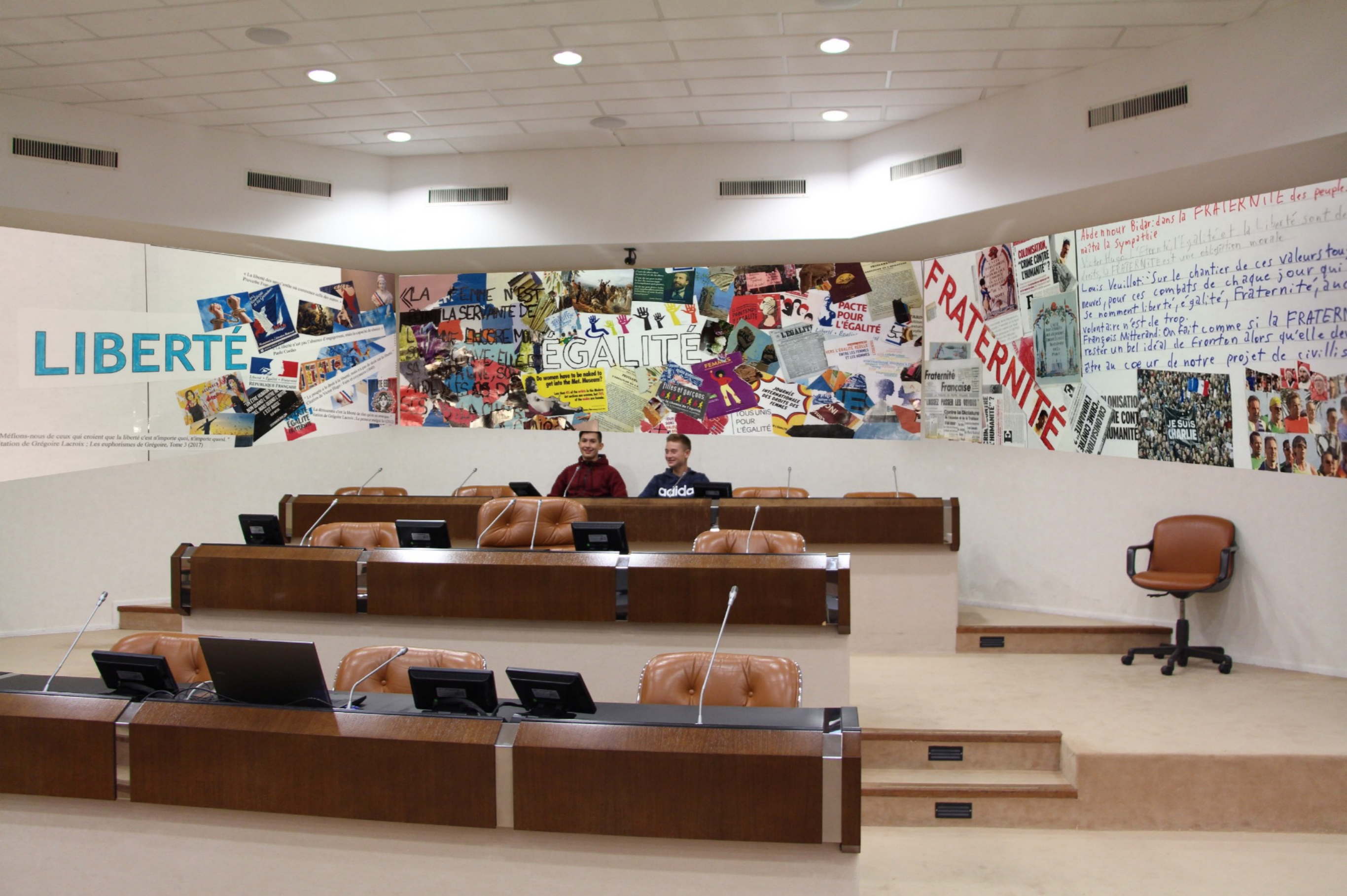
NOTRE PROPOSITION : vue de face