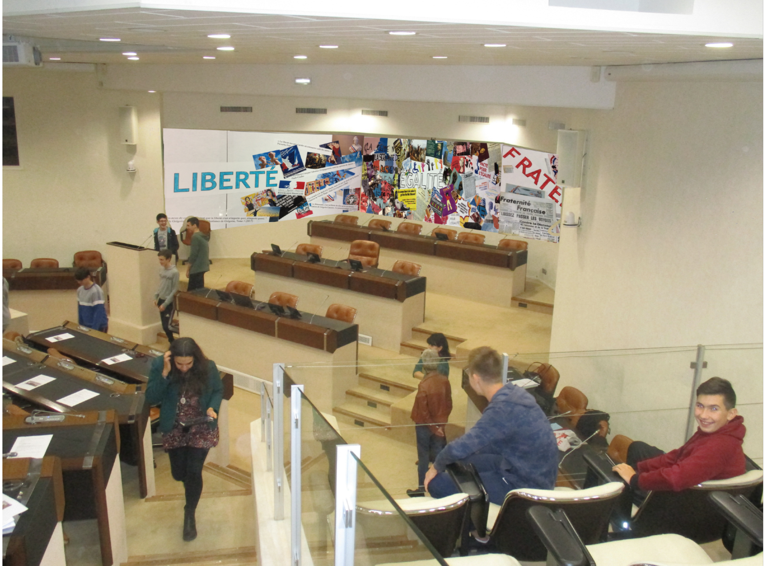
NOTRE PROPOSITION : entrée en haut à droite